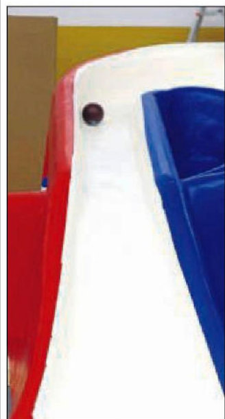
Die neue Anlage verfügt über 18 Bahnen.